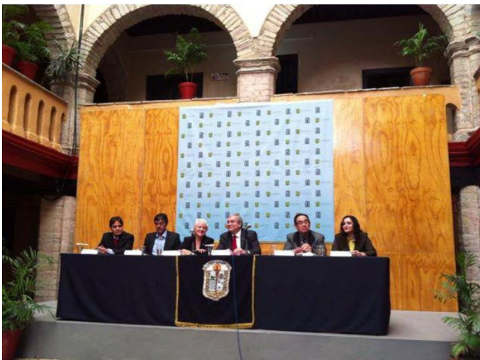
Conferencia de prensa: Mesón de San Antonio.