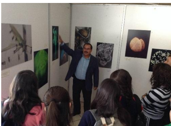
Fig. 7 Exposición en León, Gto.