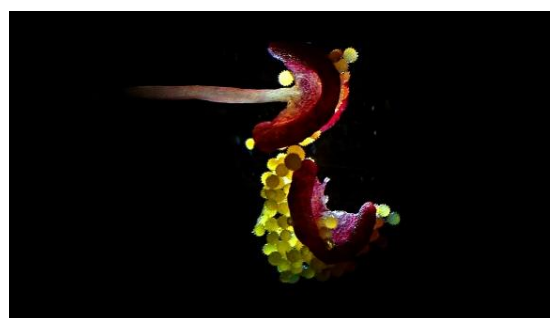
Fig. 4 Anteras y granos de polen.