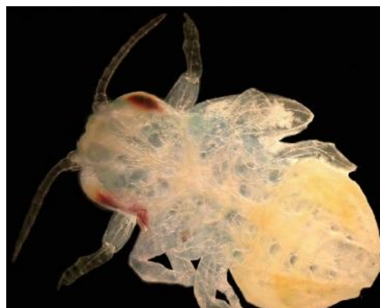
Fig. 3 Pulga de la hoja del limón