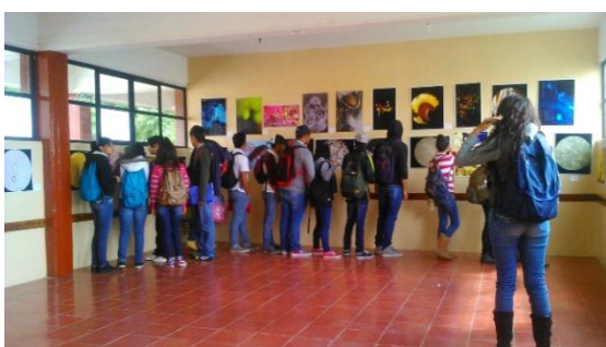
Fig. 6 Exposición en Guanajuato, Gto.

Algunas fotografías de las exposiciones se muestran en las Figuras 6-8 .