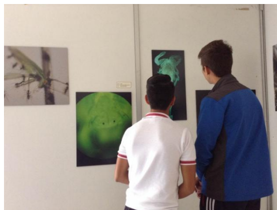
Fig. 8 Exposición en León, Gto.