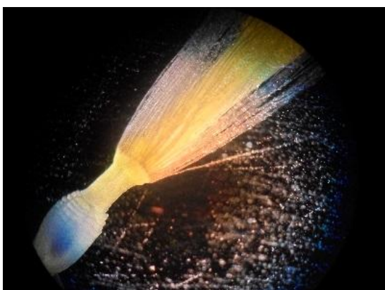
Fig. 1 Parte de una flor.

Durante los años 2013 y 2017 se realizaron 8 exposiciones de 3 a 10 días cada una y se atendieron en promedio a 200 personas en cada una, entre estudiantes y público en general (incluyendo turistas). En algunos eventos como la feria ecológica infantil en la Cd. De Guanajuato, se usan los microscopios y se colocan las muestras para que los niños y adultos observen en tiempo real, provocando con ello un canal de comunicación muy importante. Algunas de las fotografías mostradas en las exposiciones se muestran en las Figuras 1-5 .